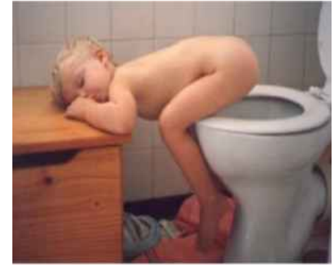
Ever been this tired?